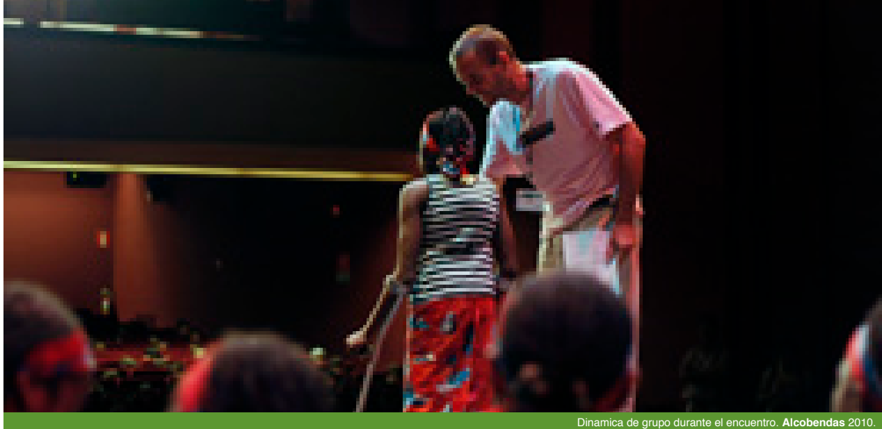
Dinámica de grupo durante el encuentro. Alcobendas 2010.