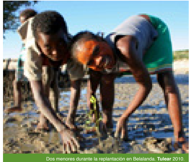
Dos menores durante la replantación en Belalanda. Tulear 2010.

Pincha aquí para ver un video sobre el proyecto.