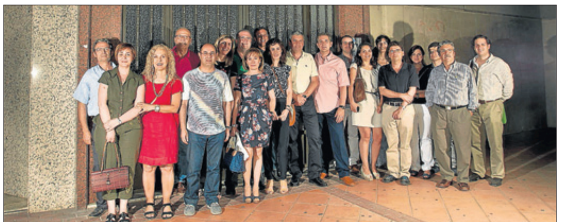
Grupo de fundadores a las puertas del Colegio Oficial de Médicos de Murcia.

En España hay seis millones de pacientes con dolor crónico, hasta la mitad de los pacientes hospitalizados sufren dolor agudo y el 85% de los pacientes con cáncer sufre durante el tratamiento.