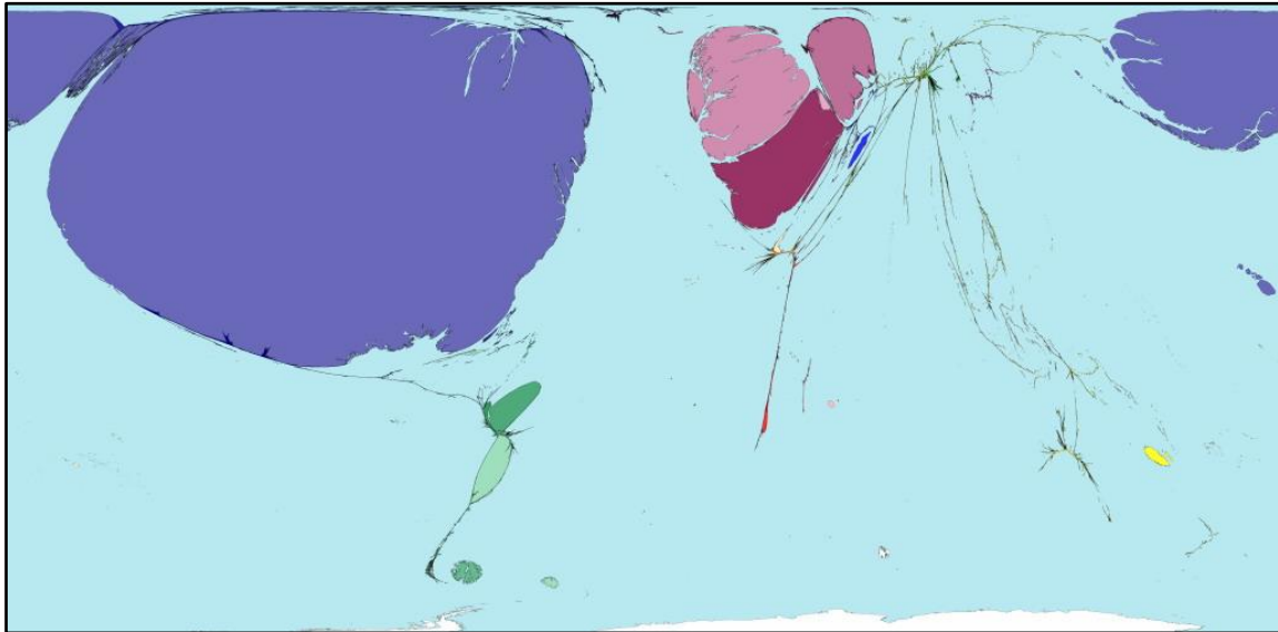
El món segons l'exportació de drets de llicència

La figura següent mostra la distribució al planeta dels drets de llicència, on cada país es mostra de tamany proporcional a l'exportació neta de drets de llicència. Els països que no es mostren són importadors de drets de llicència.