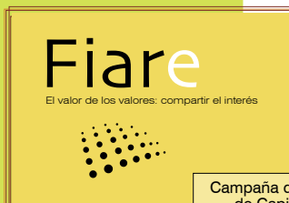
Campaña de Captación de Capital Social

Se ha constituido la Asociación Fiare Navarra formada por la CONGD, Red Pobreza y REAS Navarra (estas tres redes representan a más de 150 colectivos). Comienza la Campaña de Captación de Capital Social: para el año 2011 hace falta acumular un millón y medio de euros en todo el estado. Podemos hacer aportaciones personales desde 100 euros y colectivas desde 500 euros . En Pamplona la oficina de Fiare abre los martes de 17 a 19 horas en IPES (Calle Tejería). Las sedes de Caja Laboral ayudarán a este cometido. Al cierre de este boletín el movimiento de FIARE está repartido en: