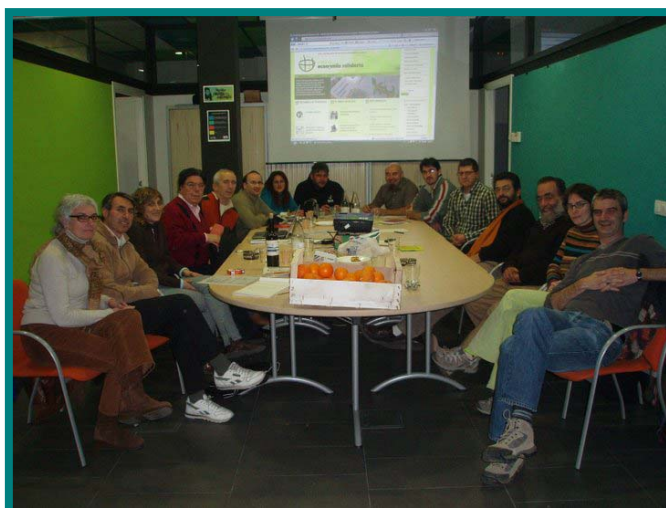
Comisión de REAS Red de Redes Mercado Social.

“Construir un espacio de consumidores, proveedores y distribuidores, donde la ciudadanía podamos ejercer nuestra opción de consumo con compromiso social”.