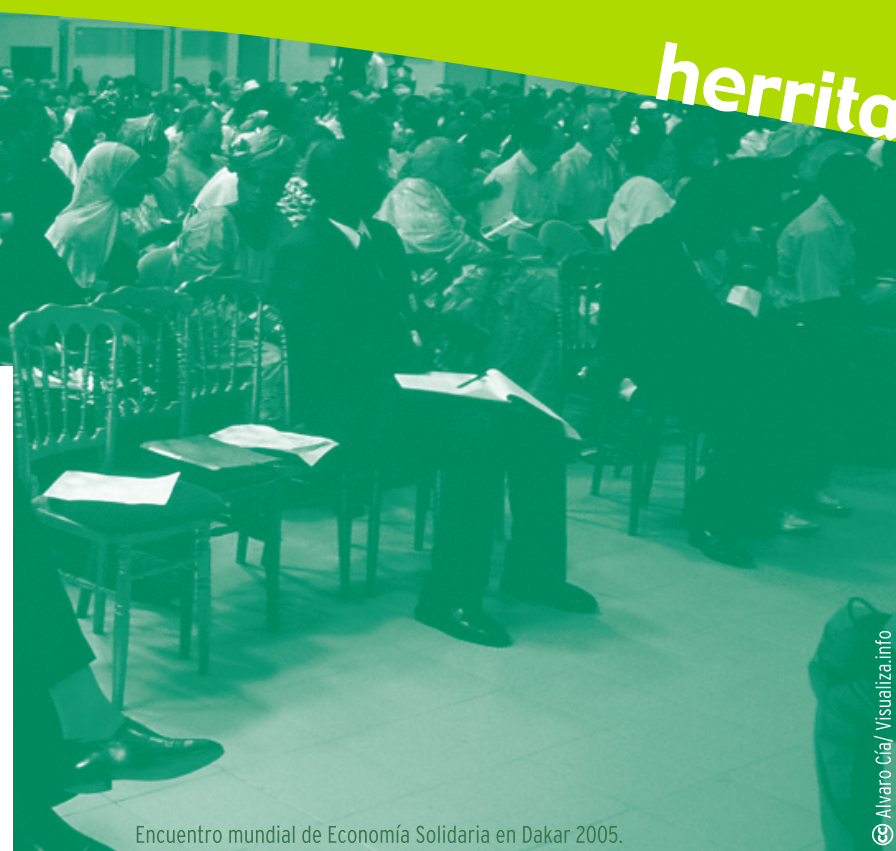
Encuentro mundial de Economía Solidaria en Dakar 2005.