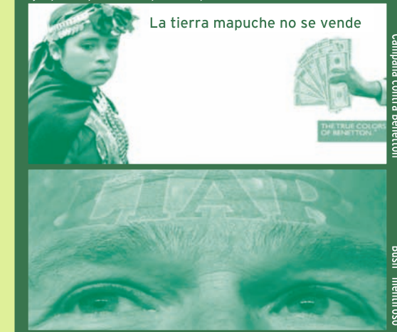
La tierra mapuche no se vende