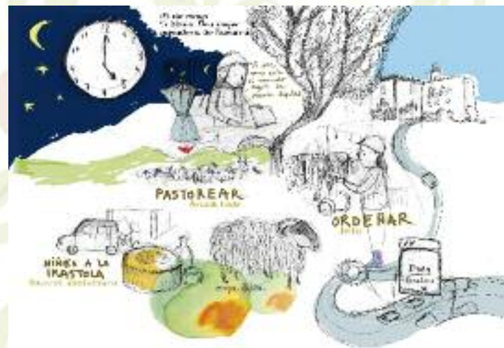
Elikadura-burujabetza da herriek beren elikaduraz eta tokiko elikadura-sistemez erabakitzeke duten eskubidea

Con cada producto que ponemos en nuestro plato a la hora del desayuno, de la comida o de la cena, podemos decidir entre dos alternativas: formar parte de un sistema que agota los recursos naturales, expulsa a la gente de sus tierras, crea unas condiciones laborales miserables, colabora