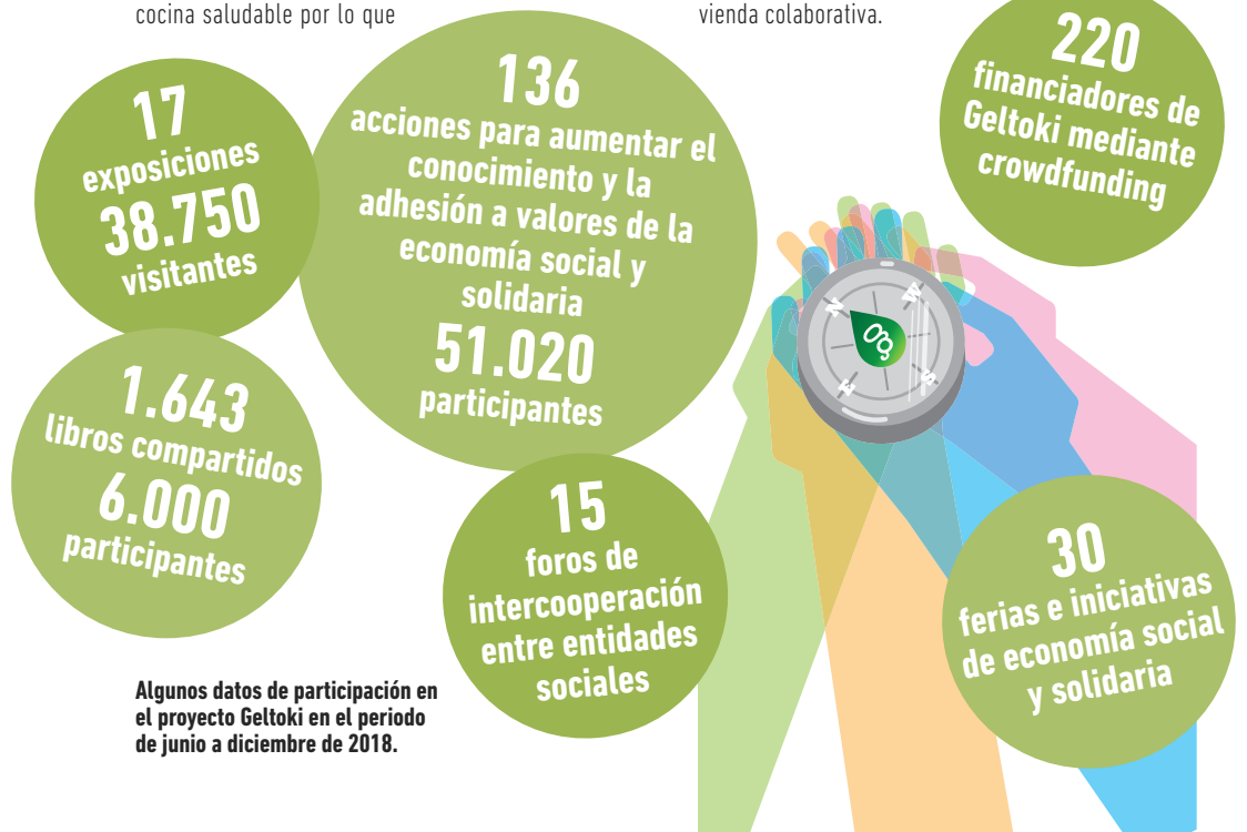
Algunos datos de participación en el proyecto Geltoki en el periodo de junio a diciembre de 2018.

Geltokirentzako garrantzitsua da ekonomia sozial eta solidarian daude ekimen eta enpresen bozgorailu izatea, horretarako informazio puntu ezberdinak izaten ditugu asteko egun ezberdinetan zehar. Amaitzeko gure helburua eragile eta elkarte hauen artean sinergiak batzea da, kanpaina eta eztabaida-lekuak sortuz.