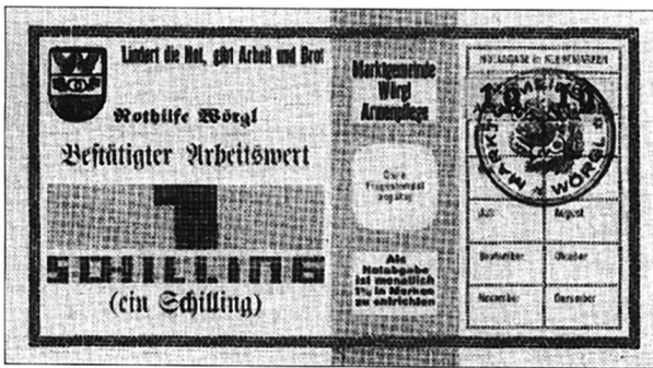
El Municipio de Wörgl (Austria), julio de 1932 a enero 1933.