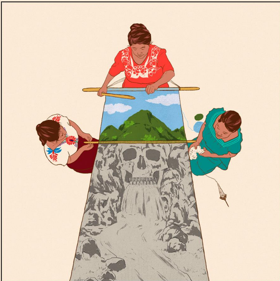
Ilustración de Cristina Jiménez