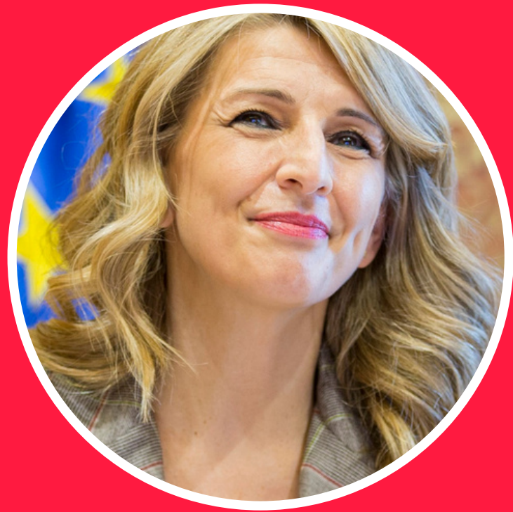
Yolanda Díaz, Ministra de Trabajo y Economía Social

"Tenemos un reto muy importante: involucrar a las personas jóvenes para preparar el necesario cambio generacional".