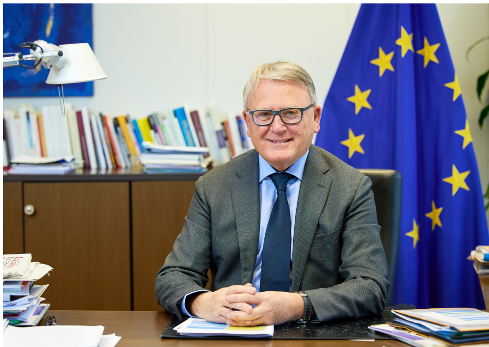
Nicolas Schmit, Comisario Europeo de Empleo y Derechos Sociales

Este informe de CEPES será sin duda una fuente de inspiración a la que los Estados miembros recurrirán a la hora de aplicar la futura Recomendación del Consejo. Debemos aprovechar todas las oportunidades que se nos presenten para compartir las mejores prácticas y aprender los unos de los otros.