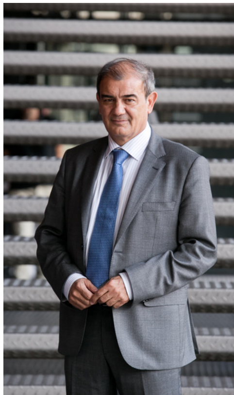
Juan Antonio Pedreño Frutos, presidente de CEPES y de Social Economy Europe

Las conclusiones y resultados de este proceso de aprendizaje, que abarcó 2021 y parte de 2022, son muy valiosos justo en este momento, en el que la UE, la OCDE, la OIT y, muy pronto, Naciones Unidas con su futura Resolución sobre Economía Social, se están volcando en poner las bases de un ecosistema global favorable a una economía al servicio de las personas y del planeta.