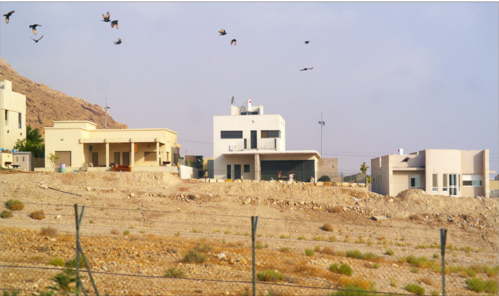
Asentamiento ilegal Kibbutz Kali, Valle del Jordán.